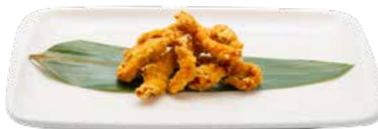
05 · TIRAS IBERICO Deliciosas tiras de carne ibèrico marinados con especies y rebozados alergènos: 1-3-6-7-11