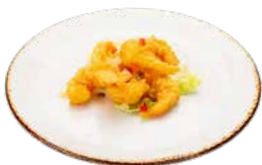
244 · GAMBAS DEL CHEF 🌶️ Gambas peladas y crujientes al estilo del chef alérgenos: 1-2-3