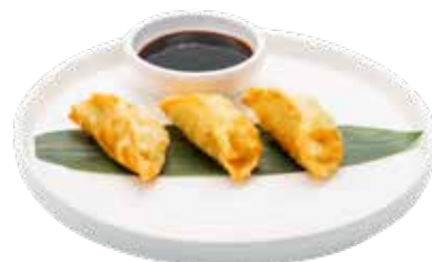
36 · GYOZA DE POLLO FRITO Empanadilla japonesa de pollo con verduras rebozados alergènos: 1-3-4-6-7-8-9-10-11-13-14