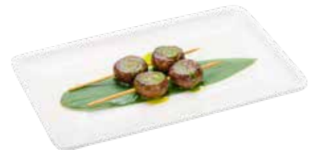
224 · BROCHETAS DE SHIITAKE Shiitake a la plancha con salsa verde alérgenos: 1-6-14