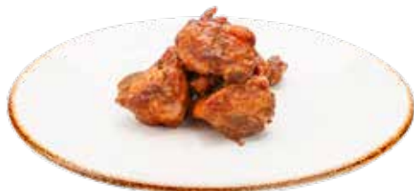
21 · COSTILLAS DE CERDO Deliciosos costillas de cerdo marinados y rebozados alergènos: 1-3-4-6-12-14