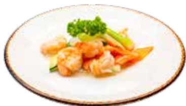
241 · GAMBAS CINCO COLORES Gambas salteadas con 5 tipos de verduras alérgenos: 2-3-9