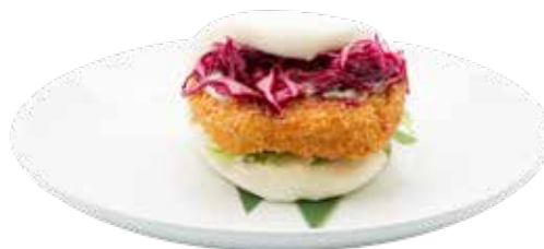
18 · POLLO CRISPY BAO Bao relleno de pollo crujiente, salsa césar y repollo morado marinado alergènos: 1-3-6-7