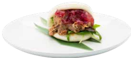
19 · PULLED PORK BAO Bao relleno de pulled pork en salsa bbq oriental y cebolla caramelizada alergènos: 1-6-10-11