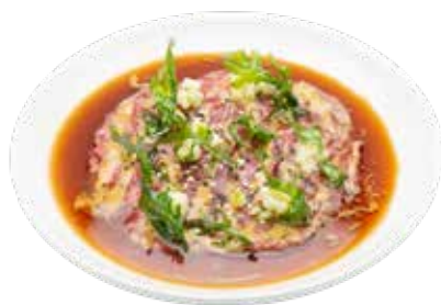
06 · CARPACCIO DE TENERA Carpaccio de tenera flambeado con salsa mostaza y miel, ponzu y rùcula cujiente alergènos: 1-6-10-11