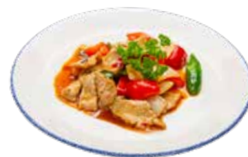
229 · TERNERA PICANTE 🌶️ Laminas de ternera salteadas con verduras y salsa picante alérgenos: 1-3-6-14