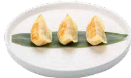
33 · GYOZA DE LANGOSTINOS AL GRILL Empanadilla japonesa de langostinos y verduras a la plancha alergènos: 1-2-6-9