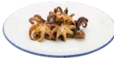
219 · PULPITOS A LA PLANCHA Pulpito a la plancha con salsa verde alérgenos: 1-6-14