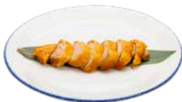
227 · PATO ASADO Pato asado con toque de hierbas orientales alérgenos: 1-3-6-11