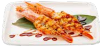
216 · EBI YAKI Gambones a la plancha con salsa teriyaki y sesamo alérgenos: 1-2-6-11