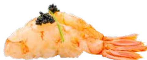
124 · AMAEBI Gambas crudas sobre la bola de arroz y tobiko* alérgenos: 1-2-4-6