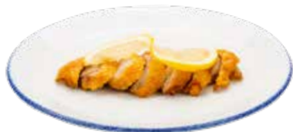
225 · PATO LIMON Pato asado con salsa de limon alérgenos: 1-3-6