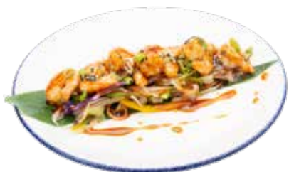
247 · GAMBAS YAKINIKU Gambas salteadas en salsa yakiniku, verduras salteadas y semilla de sésamo alérgenos: 2-6-10-11