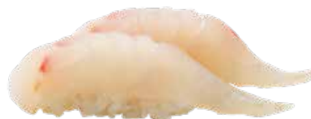
122 · TAI Lamina de lubina sobre la bola de arroz alérgenos: 4