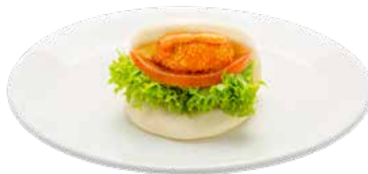
20 · BAO DE LANGOSTINOS Bao relleno de langostino en tempura con mezcla de hojas verdes, tomate y salsa rosa alergènos: 1-2-3-4-6-7-10