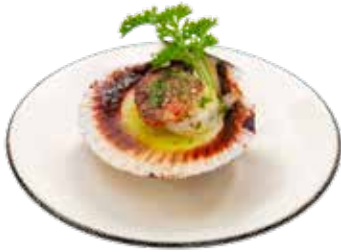
215 · VIERAS A LA PLANCHA Mini vieiras a la plancha con salsa verde alérgenos: 1-2-6-14