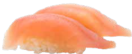
121 · MAGURO Lamina de atun sobre la bola de arroz alérgenos: 4