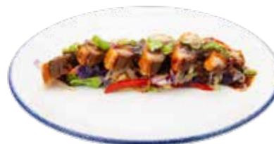
232 · PATO THAI Pato asado con verduras, cacahuets y cebollino salteados en salsa tailandesa alérgenos: 1-5-6