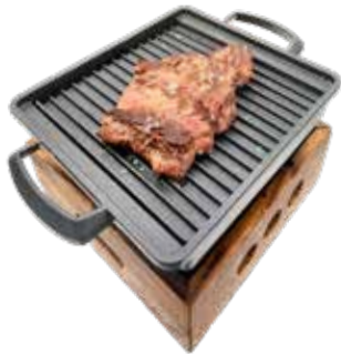
222 · TERNERA GRILL Ternera echo al grill alérgenos: /