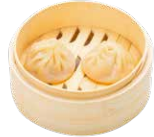
31 · XIAO LONG BAO Saqitos rellenos de carne y verduras al vapor alergènos: 1-3-6-7-8-9-11-14