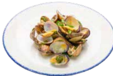
223 · ALMEJAS CON SALSA VERDE Almejas a la plancha con salsa verde alérgenos: 1-6-14