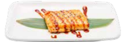
217 · SAKE YAKI Lomo de salmon a la plancha con salsa teriyaki y sesamo alérgenos: 1-4-6-11