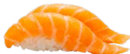
120 · SAKE Lamina de salmon sobre la bola de arroz alérgenos: 4