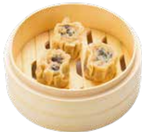
35 · SAUMAI DE POLLO Deliciosos saquitos rellenos de pollo con setas y cebollino alergènos: 1-6-9-11-14