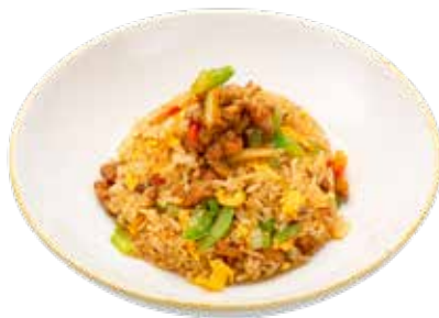
195 · ARROZ CON TERNERA Arroz salteados con verduras y ternera con salsa soja alérgenos: 1-3-6-11-14