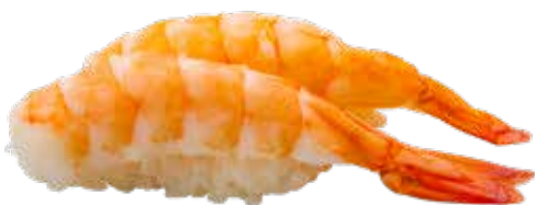
123 · EBI Langostino cocido sobre la bola de arroz alérgenos: 2