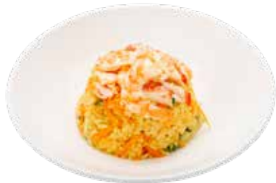
193 · KAISEN GOHAN Arroz salteado con huevo y menestra de mariscos y verduras alérgenos: 1-2-3-4-6-14