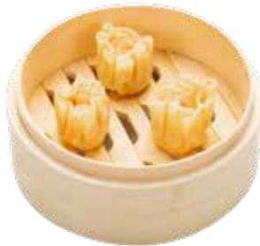
32 · SAUMAI Saqito relleno de langostino, carne y verduras alergènos: 1-2-6