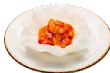
242 · GAMBAS THAI 🌶️ Gambas salteadas con verduras al estilo thai alérgenos: 1-2-3-6