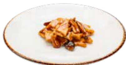
230 · TERNERA CON BAMBU Y SETAS Laminas de ternera salteada con bambu y setas alérgenos: 1-3-6-14