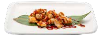
221 · YAKITORI Brochetas Tradicionales de pollo a la plancha con salsa teriyaki y sesamo alérgenos: 1-4-6-11