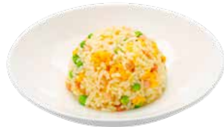
194 · ARROZ AL CANTONES Tradicional arroz salteado con huevo, guisantes y jamon york alérgenos: 1-3-6-14