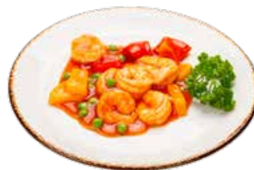
245 · GAMBAS AGRIDULCE Gambas salteadas con salsa agridulce alérgenos: 2-3-11-14