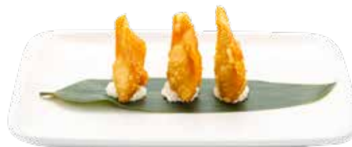
02 · WANTUNG FRITO Pasta de wantung relleno de cangrejo y Philadelphia alergènos: 1-2-7-12