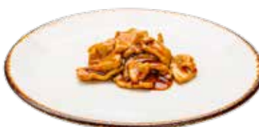
228 · TERNERA CON SALSA DE OSTRAS Laminas de ternera salteadas con salsa de ostra alérgenos: 1-3-6-14