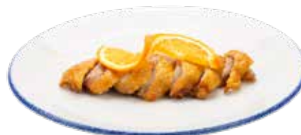
226 · PATO NARANJA Pato asado con salsa de naranja alérgenos: 1-3-6