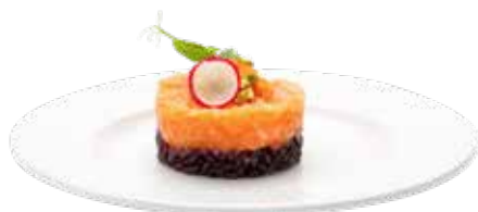
169 · TARTAR DE SALMON Y PISTACHO € 14,00 Tartar de salmon sobre de arroz negro con virutas de pistacho, Philadelphia, tobiko* y salsa teriyaki alérgenos: 1-3-4-6-7-8-10-11