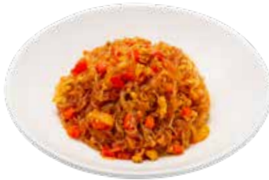
205 · FIDEOS DE SOJA PICANTE | € 7,50 🌶️ Tallarines de soja salteado con brotes de soja y pollo alérgenos: 1-6-14