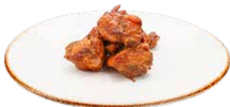
21 · COSTILLAS DE CERDO | € 7,50 Deliciosos costillas de cerdo marinados y rebozados alergènos: 1-3-4-6-12-14