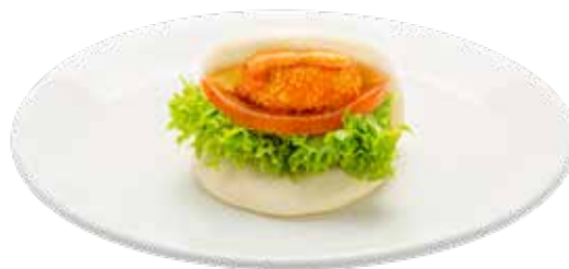
20 · BAO DE LANGOSTINOS | € 7,00 Bao relleno de langostino en tempura con mezcla de hojas verdes, tomate y salsa rosa alergènos: 1-2-3-4-6-7-10