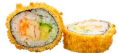
56 · HOSOMAKI NIDO | € 9,00 Rollitos envueltos con alga y arroz relleno de salmon, con Philadelphia y kataifi alergènos: 1-3-4-6-7-11