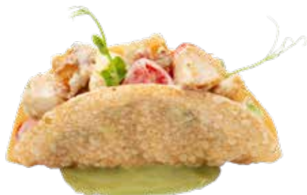
161 · TACOS POLLO | € 7,00 🌶️ Tacos rellenos de pollo en tempura, aguacate, cebolla morada, tomate y salsa spicymayo alérgenos:1-3-6-7