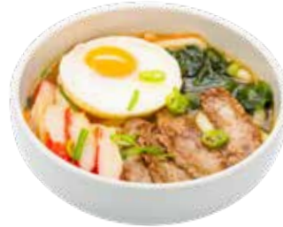
213 · SOPA RAMEN CON TERNERA | € 9,00 Tallarines ramen en caldo con huevo a baja temperatura, verduras y filete de ternera alérgenos: 1-2-3-4-6-14