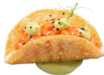
162 · TACO SALMON | € 8,00 🌶️ Tacos relleno de Tartar de salmon, Philadelphia con salsa guacamole y sesamo alérgenos: 1-3-4-6-7-11