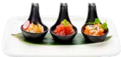
165 · TRES DE TARTAR | € 14,00 Degustacion variado de tartar de pescado con tobiko* alérgenos: 1-3-4-6-10-11