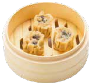
35 · SAUMAI DE POLLO | € 6,00 Deliciosos saqitos rellenos de pollo con setas y cebollino alergènos: 1-6-9-11-14