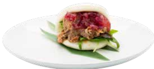
19 · PULLED PORK BAO | € 6,00 Bao relleno de pulled pork en salsa bbq oriental y cebolla caramelizada alergènos: 1-6-10-11