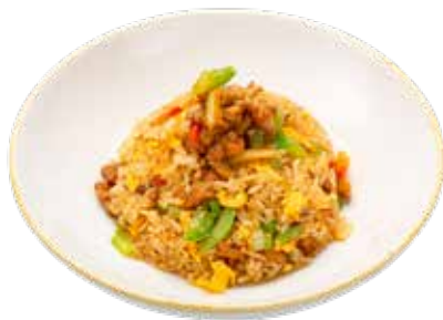
195 · ARROZ CON TERNERA | € 6,50 Arroz salteados con verduras y ternera con salsa soja alérgenos: 1-3-6-11-14