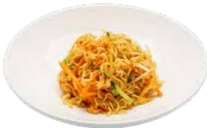
208 · RAMEN VERDURAS € 7,50 🌿 Tallarines ramen salteada con verduras y huevo alérgenos: 1-3-6-9-14