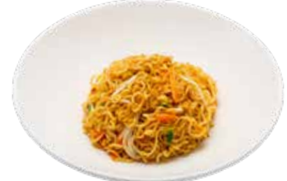
207 · RAMEN SALTEADO CON POLLO | € 7,50 Tallarines ramen salteado con pollo, verduras y huevo alérgenos: 1-3-6-9-14