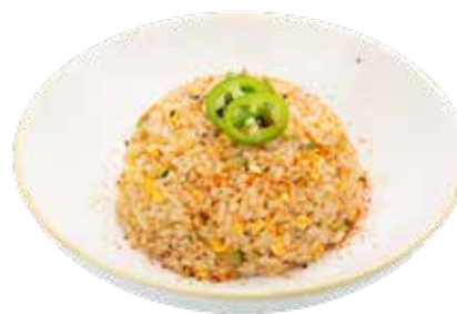
196 · ARROZ SPICY POLLO | € 6,50 🌶️ Arroz salteados con verduras, pollo picante con jalapeño y shichimi alérgenos: 1-3-6-11-14