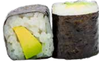
51 · HOSOMAKI AGUACATE | € 4,00 🌿 Rollitos envueltos con alga y arroz relleno de aguacate alergènos: /