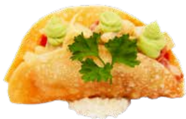
158 · TACOS VEGGIE | € 7,00 🌶️ Nachos rellenos de aguacate, cebolla morada, tomate y salsa spicymayo alérgenos: 1-3-6-7