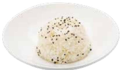
191 · GOHAN | € 3,00 🌿 Bol Arroz blanco con sesamo alérgenos: 11