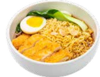
214 · SOPA RAMEN CON POLLO | € 9,00 Tallarines ramen en caldo con huevo a baja temperatura, verduras y pollo alérgenos: 1-2-3-6-9-11