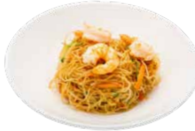
206 · FIDEOS DE ARROZ IMPERIAL | € 7,50 Fideos hecho de arroz salteados con langostinos, verduras y huevo alérgenos: 1-2-3-4-6-8-11-14