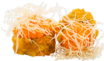
55 · HOSOMAKI SPICY SALMON | € 9,00 🌶️ Rollitos envueltos con alga y arroz rebozado, relleno de salmon, con tartar de salmon, salsa teriyaki y kataifi y tobiko* alergènos: 1-2-3-4-6-7-10-11