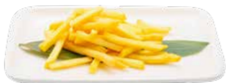
04 · PATATAS FRITAS | € 4,00 🌿 Stick de patatas fritas alergènos: 1