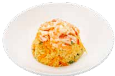
193 · KAISEN GOHAN | € 6,50 Arroz salteado con huevo y menestra de mariscos y verduras alérgenos: 1-2-3-4-6-14