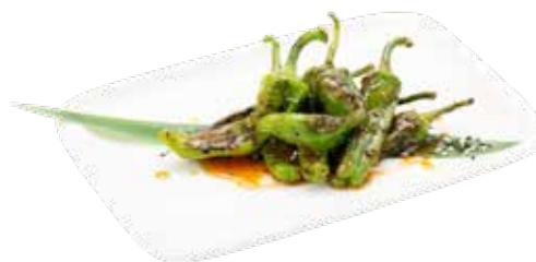
07 · PIMIENTOS PADRON | € 4,50 🌿 🌶️ Pimientos verdes salteados en salsa soja picante alergènos: 1-6-11