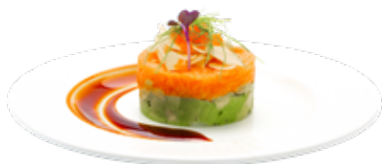
167 · TARTAR MIHO | € 14,00 Tartar de salmon con Philadelphia y aguacate con laminas de almendras, tobiko* y salsa teriyaki alérgenos: 1-3-4-6-7-8-10-11