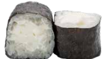
52 · HOSOMAKI PHILADELPHIA | € 4,00 🌿 Rollitos envueltos con alga y arroz relleno de queso Philadelphia alergènos: 7