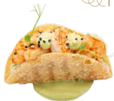
160 · TACOS LANGOSTINO | € 8,00 Tacos rellenos de langostino con aguacate, cebolla morada y tomate con salsa mayo alérgenos: 1-2-3-6-7