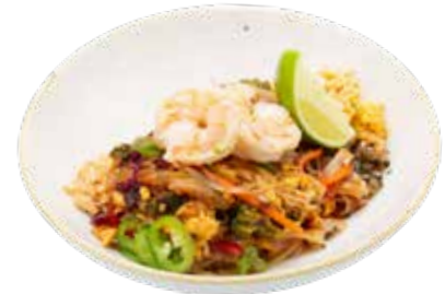
204 · PADTHAI LANGOSTINOS € 9,00 🌶️ Pasta tailandesa salteada con langostinos y verduras, cacahuete y chiles picantes alérgenos: 2-3-5-6-11