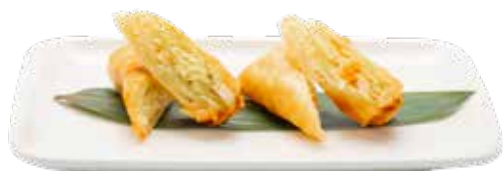
01 · HARUMAKI VERDURAS | € 3,50 🌿 Rolls rebozados con relleno de verduras alergènos: 1-3-7