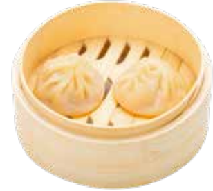
31 · XIAO LONG BAO | € 5,50 Saqitos rellenos de carne y verduras al vapor alergènos: 1-3-6-7-8-9-11-14