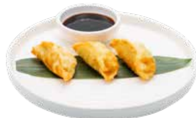
36 · GYOZA DE POLLO FRITO | € 7,50 Empanadilla japonesa de pollo con verduras rebozados alergènos: 1-3-4-6-7-8-9-10-11-13-14