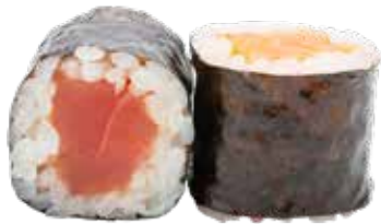
53 · HOSOMAKI MIX | € 5,50 Rollitos envueltos con alga y arroz relleno de pescado mixto alergènos: 4