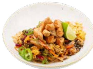
203 · PADTHAI POLLO € 9,00 🌶️ Pasta tailandesa salteada con pollo y verduras, cacahuete y chiles picantes alérgenos: 3-5-6-11