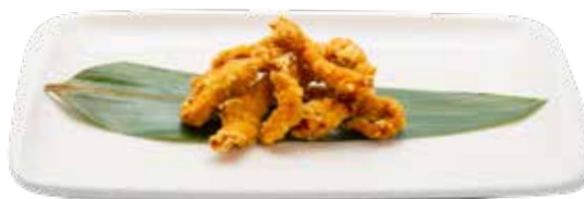
05 · TIRAS IBERICO | € 6,50 Deliciosas tiras de carne ibèrico marinados con especies y rebozados alergènos: 1-3-6-7-11