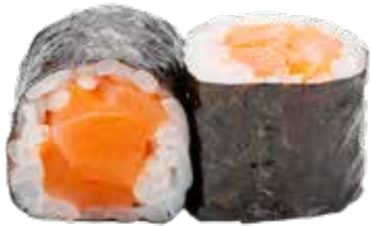
50 · HOSOMAKI SAKE | € 5,00 Rollitos envueltos con alga y arroz relleno de salmon alergènos: 4