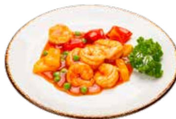
245 · GAMBAS AGRIDULCE | € 8,50 Gambas salteadas con salsa agridulce alérgenos: 2-3-11-14