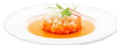
166 · SAKE TARTAR | € 12,00 Tartar de salmon en salsa ponzu y cubierta de granitos de tempura y tobiko* alérgenos: 1-3-4-6-7-10