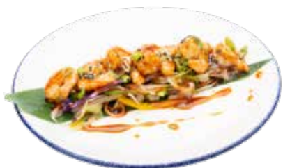
247 · GAMBAS YAKINIKU | € 9,00 Gambas salteadas en salsa yakiniku, verduras salteadas y semilla de sésamo alérgenos: 2-6-10-11