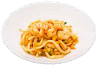
200 · EBI YAKI UDON | € 9,00 Tallarines de arroz grueso salteado con mix de verduras, langostinos y huevo alérgenos: 1-2-3-4-6-9-14