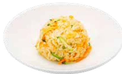
192 · YASAI GOHAN | € 4,00 🌿 Arroz salteado con mix de verduras y huevo alérgenos: 1-3-6-14