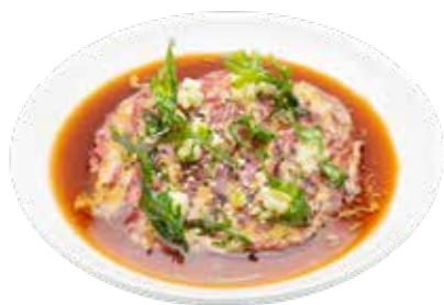
06 · CARPACCIO DE TENERA | € 14,00 Carpaccio de tenera flambeado con salsa mostaza y miel, ponzu y rùcula cujiente alergènos: 1-6-10-11