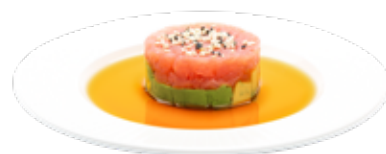
168 · TUNA TARTAR | € 14,00 Tartar de atun sobre base de aguacate con salsa yuzu y sesamo alérgenos: 1-4-6-11